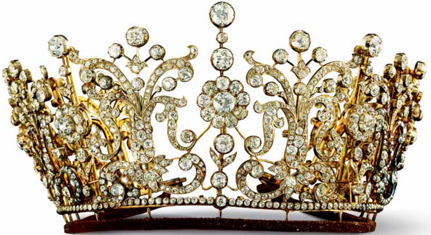
Garrard (juwelier sinds ca 1830), 'Poltimore Tiara', ca. 1870, verschillend slijpsel diamant gezet in goud en zilver. Losse elementen zijn om te zetten in een collier of broche, privécollectie.