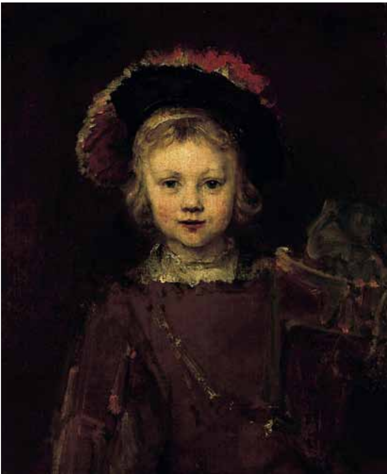
Rembrandt van Rijn (1606 - 1669), 'Portret van de schilder zijn zoon Titus', ca 1655, olieverf op doek